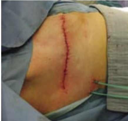
▣ Borstampatie ▣