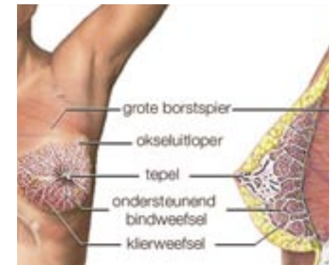
▣ Anatomie van de borstklier ▣

vallen en vernietigen. Door een ontsteking of kanker zullen lymfeklieren vergroten.