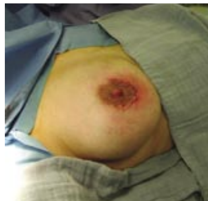
▣ Borstsparende heekunde ▣

Bij een goedaardige aandoening zal de gynaecoloog enkel het letsel wegnemen. Hij maakt daarvoor een insnede die zo klein mogelijk is en esthetisch het minst problemen veroorzaakt. Meestal zal men de operatie onder algemene verdoving of 'narcose' uitvoeren. Het verblijf in het ziekenhuis is over het algemeen beperkt tot een dag (dagkliniek). In sommige gevallen zal men na de ingreep een plastic buisje of mini-'drain' aanbrengen om het bloed en/of wondvocht af te voeren.