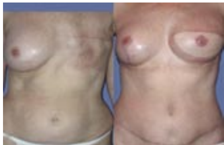
▣ Borstreconstructie ▣

Als je een borstamputatie moet ondergaan, kan je overwegen om tegelijkertijd of later een borstreconstructie te laten uitvoeren. Dit bespreek je best individueel met je gynaecoloog.